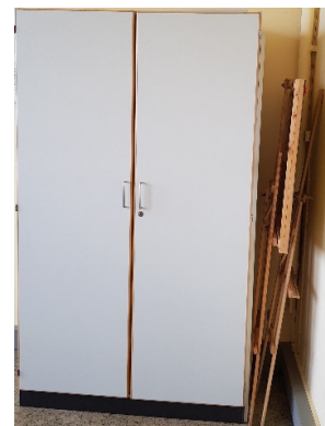
Schrank mit Demobrett